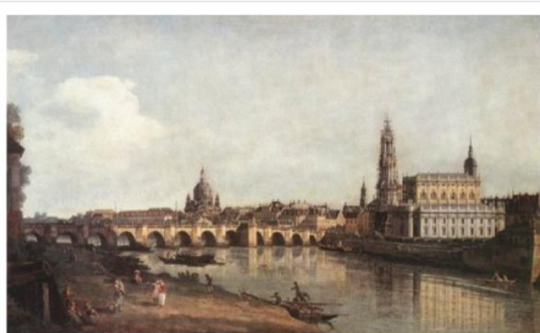
Veduta di Dresda dalla riva destra sotto il ponte di Augusto

DRESDA - Il pittore veneziano Bernardo Bellotto, nel 1750 ha dipinto alcuni luoghi della città di Dresda. Questi sono i suoi quadri.