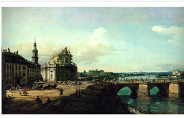
La Hofkirche di Dresda con il castello e il ponte di Augusto