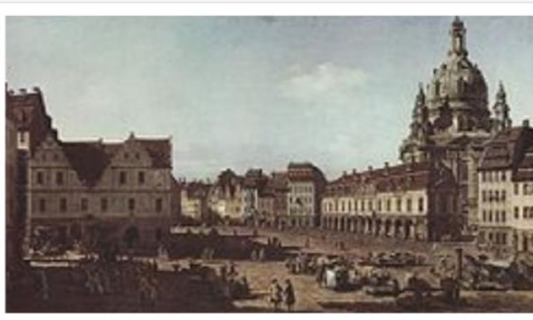
Veduta di Dresda con la Frauenkirche