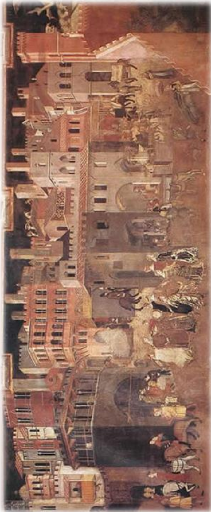
Allegoria del buon governo del Lorenzetti (1338-1339)

Quali elementi della città medievale vedi in questo disegno?