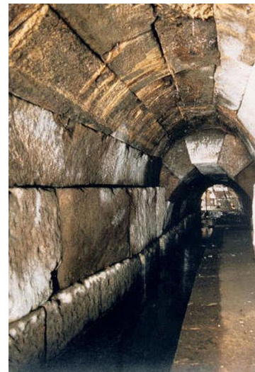
Fognatura - Cloaca Maxima