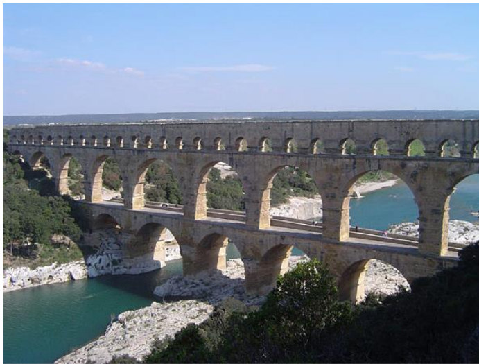
Acquedotto romano a Pont du Gard, in Francia

Nelle città romane c'erano luoghi ed edifici importanti. Il foro era uno spazio aperto molto grande circondato da botteghe, colonnati, statue, templi, tribunale e altri edifici pubblici; era il luogo degli incontri e del commercio. Altri edifici importanti erano: l' anfiteatro (per gli spettacoli), il mercato e le terme . Inoltre, i Romani costruivano acquedotti per trasportare l'acqua da un fiume alla città e le fognature per raccogliere le acque sporche e i rifiuti.