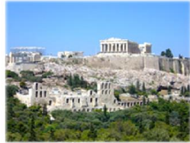
L'acropoli di Atene, in Grecia.

Tante città greche avevano anche l' acropoli , che si trovava in alto su una collina. Intorno all'acropoli c'erano alte mura di protezione.