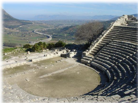
Il teatro di Segesta, in Sicilia.

Il teatro era il luogo dove gli uomini andavano a vedere gli spettacoli teatrali.